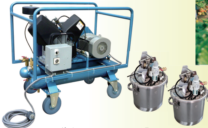
▲ダック M-222SN-C15-2DX セット品